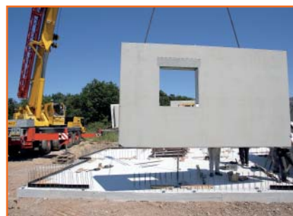
3. Die Elemente werden auf die Anschlussbewehrung der Bodenplatte gesetzt.