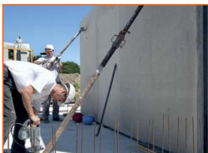
4. Die aufgestellten Wandbauteile werden millimetergenau ins Lot gestellt.