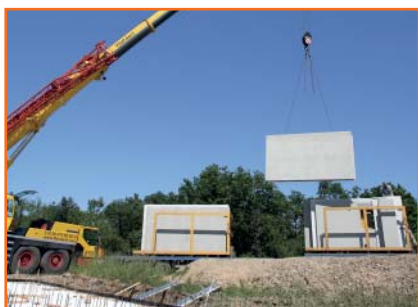
1. Entladung der Wandbauteile mit dem Romey-Spezialfahrzeug.