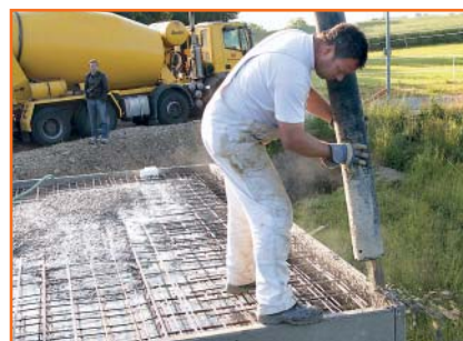
6. Zum Schluss werden die Wände (in der Regel zusammen mit der Decke) mit Ortbeton ausgegossen.