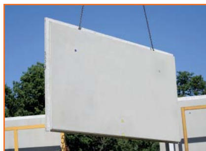
2. Montage der Wandbauteile in der Reihenfolge des Verlegeplans.