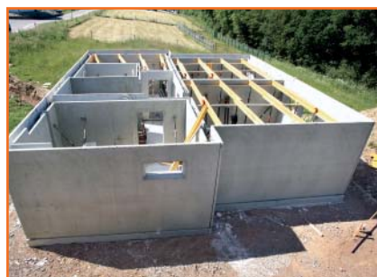
5. Nach wenigen Stunden sind die Wände fertig montiert.